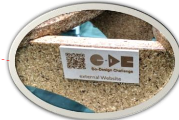
この部分に企業情報が入ります

森林や街路樹整備の際に処分されていた枝葉を、 新製品として再活用した「間伐材のベンチ」です